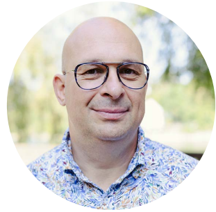
Geschätzte Damen und Herren

Zurück zur Natur: Die Themen Naturverbundenheit und Nachhaltigkeit sind seit Beginn der Corona-Pandemie noch wichtiger geworden. Viele Konsumentinnen und Konsumenten kaufen bewusster ein und legen zudem grösseren Wert auf Individualität.