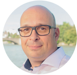
Geschätzte Damen und Herren

Jedes Jahr im Herbst leuchtet die Natur in allen erdenklichen Rotnuancen, bevor sich der Winter mit Tristesse breitmacht. Doch wir können dem Alltagsgrau ein Schnippchen schlagen. Laut dem Farbinstitut Pantone, das regelmässig die internationalen Fashion Trends analysiert, erwartet uns, zumindest was die Mode angeht, ein farbenfroher Winter. Rot ist die Trendfarbe der Saison und in allen Facetten erlaubt. Raffiniert kombiniert mit Grüntönen, Beige, Grau oder Nachtblau – mal elegant, mal sportlich – lässt sich damit ganz schön Aufsehen erregen. Freude macht das Spiel mit Farben allemal. Vielleicht ergänzen Sie das Outfit mit einer passenden neuen Brille. Wer dabei auf Qualität achtet, wird doppelt belohnt: Mit gutem Sehen und noch besserem Aussehen.